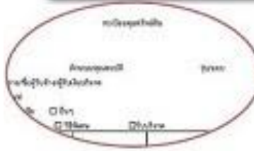
ตัวอย่างทะเบียนคุมทรัพย์สิน

ศาสตราภัณฑ์ - ลงทะเบียนคุมทรัพย์สินตามแบบที่ กวพ.กำหนด - ลงข้อมูลในระบบ POLIS